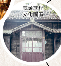
蒜頭蔗埕文化園區